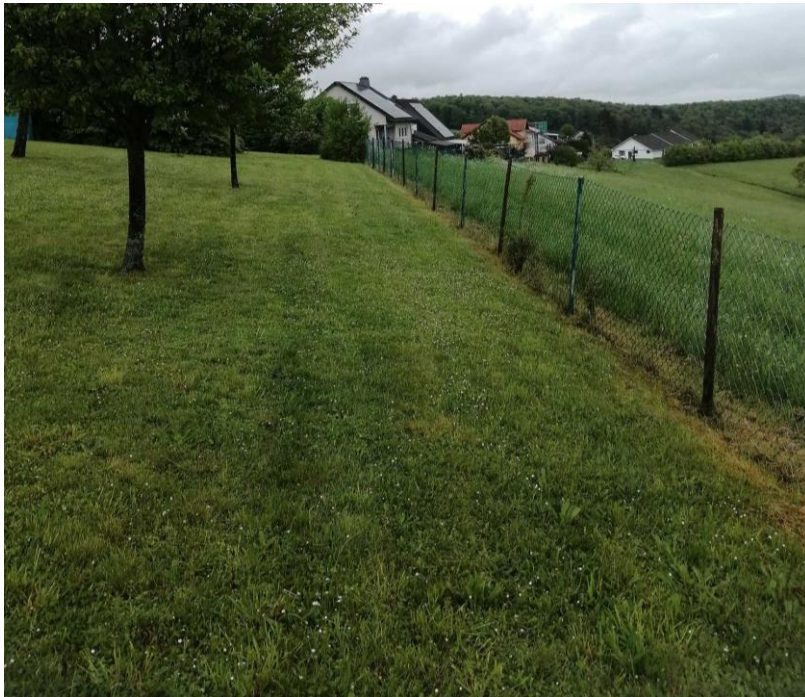
Abbildung 7: Rasenfläche innerhalb des Gartengrundstücks

Der Zierrasen im Plangebiet war zum Zeitpunkt der Kartierung am 10.05.2023 frisch gemäht. Neben Grasarten kommen einzelne Kräuter wie z.B. Löwenzahn, Gänseblümchen, Schafgarbe, breitblättriger Wegerich, scharfer Hahnenfuß, Gamander-Ehrenpreis vor.