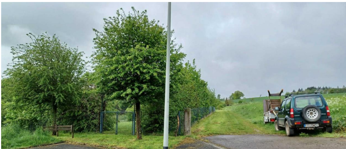
Abbildung 3: Baumhecken im Eingangsbereich an der nordwestlichen Grundstücksgrenze

Entlang der nordwestlichen und nordöstlichen Plangebietsgrenze befinden sich Baumhecken mit vereinzelt Sträuchern. Es handelt sich überwiegend um einheimische Gehölze (u.a. Hasel, Esche, Schlehe, Birke, Salweide, Buche, Bergahorn, Kornelkirsche, Liguster) mittlerer Ausprägung mit Ausnahme von Blutbuche und Rosskastanie.