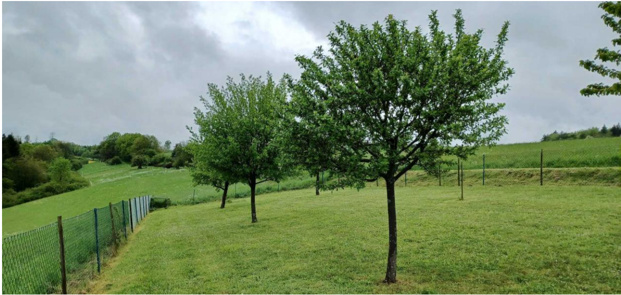
Abbildung 4: Obstbäume

das Vorhandensein von Baumhöhlen, Rissen, etc., die von Vögeln oder Fledermäusen als Fortpflanzungs- / Ruhestätten genutzt werden können.