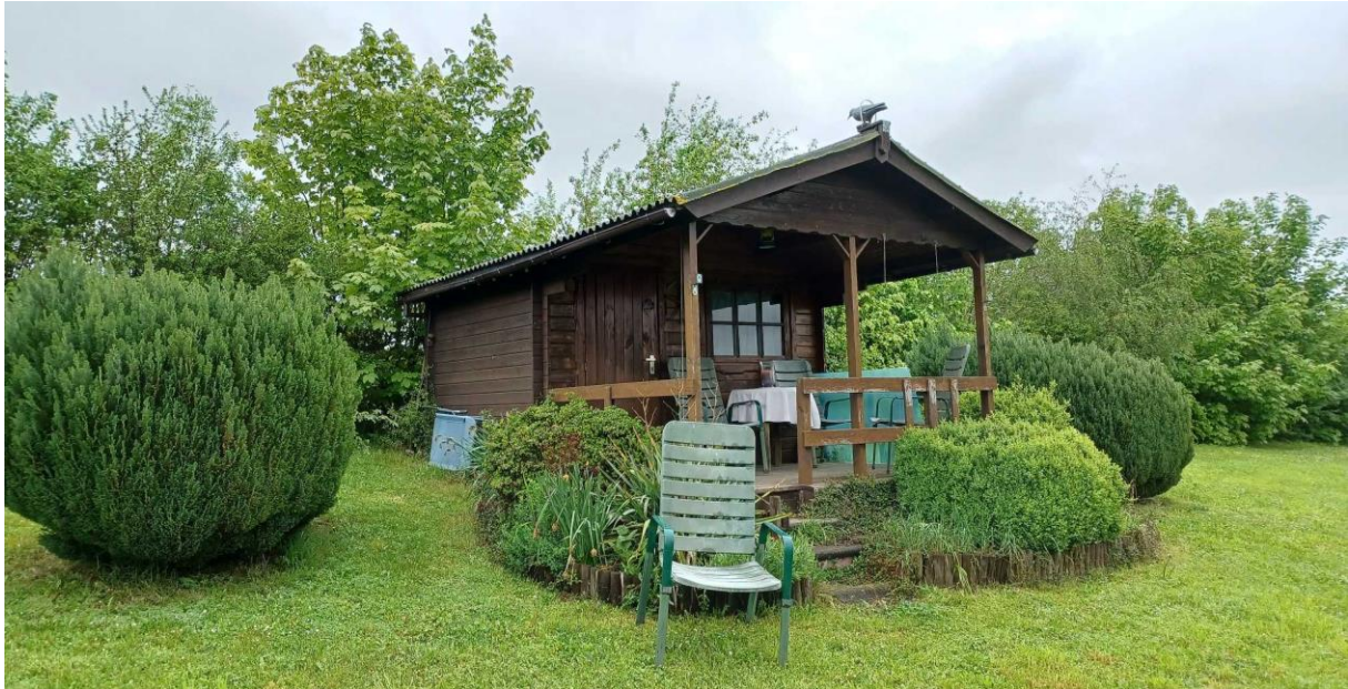
Abbildung 6: Ziergehölze