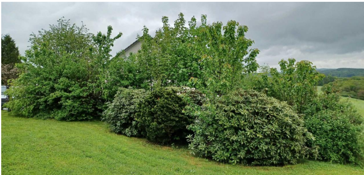
Abbildung 5: Ziergehölze (Muschelzypresse und Rhododendron) im Eingangsbereich des Grundstücks

Im nordöstlichen Bereich des Gartens sowie neben der Gartenhütte befinden sich Anpflanzungen nicht heimischer Arten, u.a. Muschelzypresse und Rhododendron, mittlerer Ausprägung.